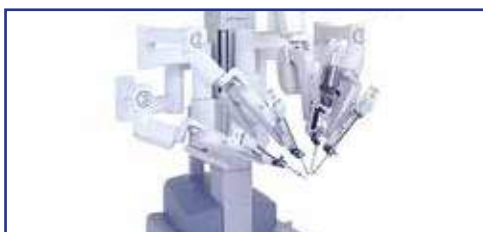
Robotický chirurg Da Vinci

Používá se: v USA, Německu, Jižní Koreji, Japonsku, Ukrajině, Singapuru, Rusku aj.