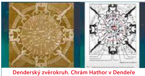
Denderský zvěrokruh. Chrám Hathor v Denderě