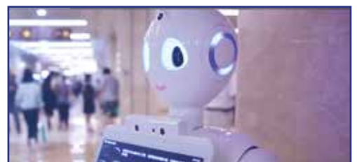
Diagnostický robot Xiaoyi

Používá se: v USA, Německu, Jižní Koreji, Japonsku, Ukrajině, Singapuru, Rusku aj.