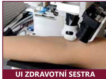
UI ZDRAVOTNÍ SESTRA