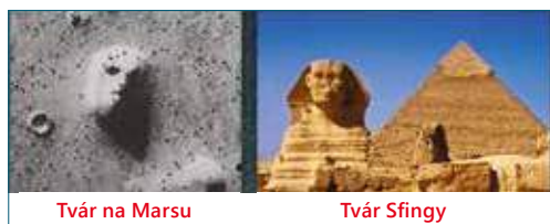
Tvář na Marsu